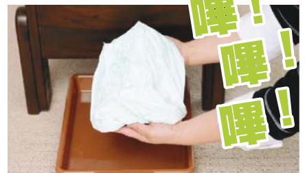
密封完成 聽到嘩嘩聲後，密封膜將自動掉下。衛生乾淨。