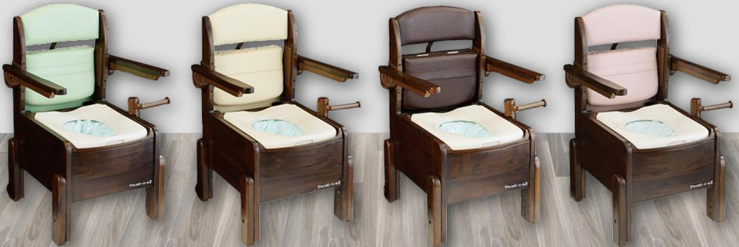
* 四種顏色可供選擇 湖水綠色、米色、深啡色、粉紅色

日常護理及照顧 在有行動不便長者的家庭、中心或院舍中，幫助長者如廁的配套及照料更顯重要。Wrappon能把排泄物密封，免沖洗的同時亦能隔絕異味及細菌，避免交叉感染。它的高度可調較，座椅配有正常的坐位墊，放置於床邊，非常方便。它可以同時方便使用者，亦能減輕護理人員的負擔。