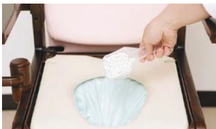
倒入指定的凝結劑 使排泄物水份凝固。

Wrappon·Aile2 操作簡單，只需按下按鈕，任何人都可以輕鬆使用這個廁所。