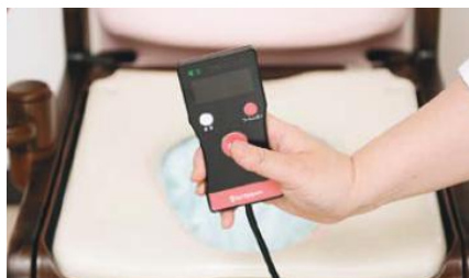
按下按鈕 上完廁所後，按下按鈕，密封開始。